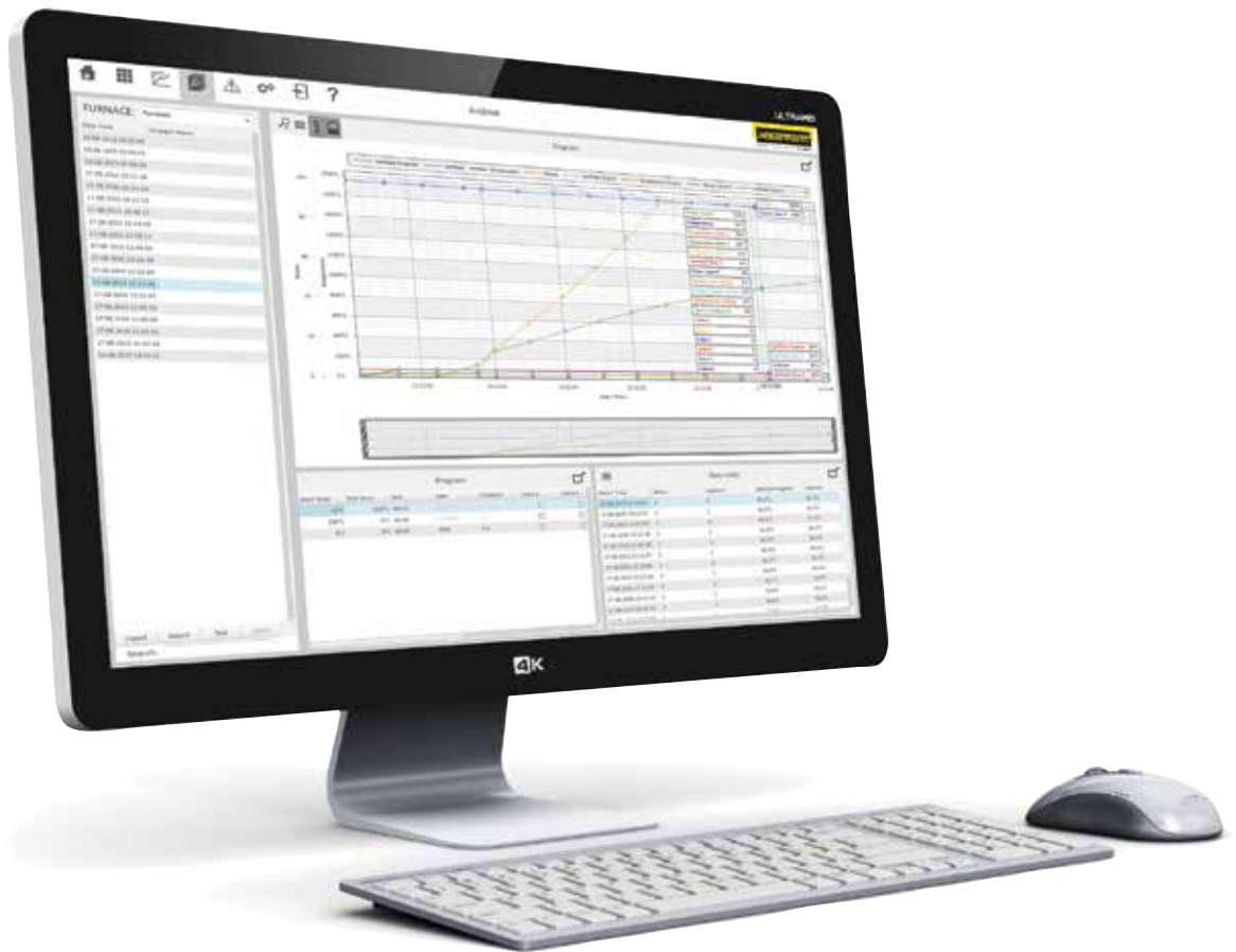
VCD-programvara för styrning, visualisering och dokumentation